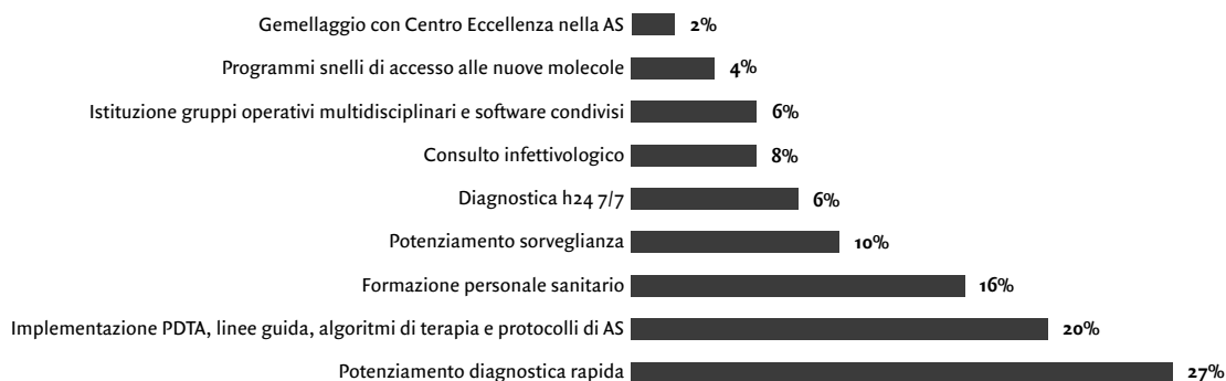
Figura 1.1 Quali potrebbero essere le soluzioni a medio-breve termine per migliorare la stewardship antimicrobica nel suo ospedale e su quali auspicherebbe il supporto di aziende produttrici?